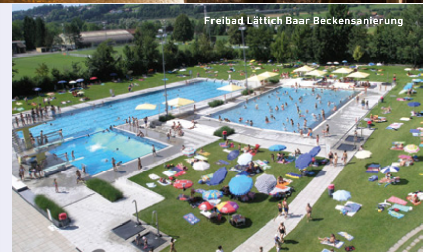
Freibad Lättich Baar Beckensanierung