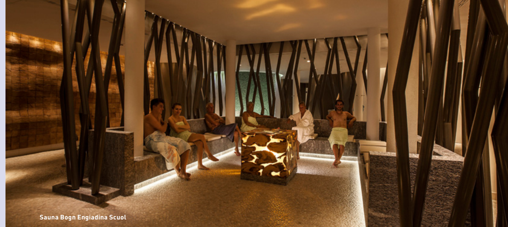
Sauna Bogn Engiadina Scuol